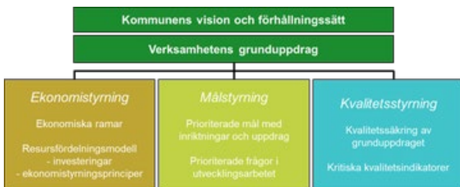
Härryda kommuns styrmodell

Målstyrning är en av de tre pelare i Härryda kommuns styrmodell, jämte ekonomi- och kvalitetsstyrning och som med hjälp av vision och förhållningssätt ska ge riktning i verksamhetens grunduppdrag.