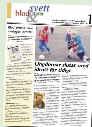
Första numret av BST utkom februari 2015

– Det är roligt att BST sätter avtryck, men vi ser över alla informationskanaler varje år, säger Annette.