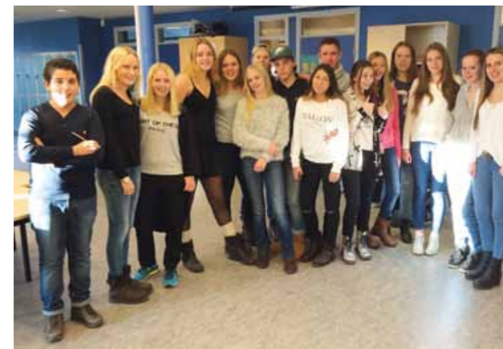
Inflytande. Ungdomar på Önnerödsskolan bjuds in att vara med och påverka hur den nya aktivitetsytan ska utformas.

Den gamla Önnerödspanen ska göras om. En del ska ingå i förskoleverksamhet, men den övriga ytan ska bli ett helt nytt spännande projekt – skapat av och för tjejer.