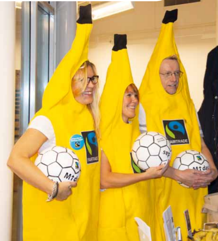
Varierat innehåll. Årets upplaga av Ledarveckan var brett och bra. Föreningarna har själva styrt innehållet.