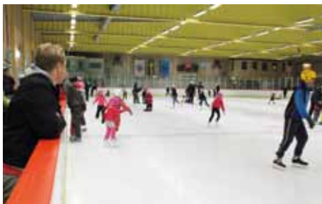
Mycket folk. Ishallen är öppen för allmänheten på fredag kväll, lördagar och söndagar.

Allmänhetens åkning: www.harryda.se/ishall 31 oktober - 31 mars Fredagar kl. 18.30-20.00 Lördagar och söndagar kl. 12.00-13.30.