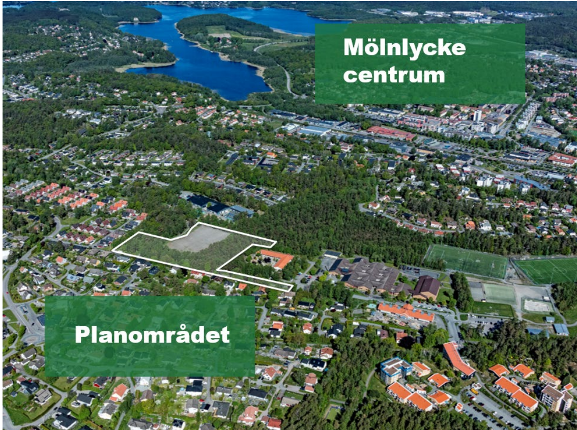
Planområdets läge i södra Mölnlycke inom vit markering

Detaljplan för del av Hulebäck 1:34 m. fl., NY SKOLA I DJUPEDALSÄNG i Mölnlycke, Härryda kommun