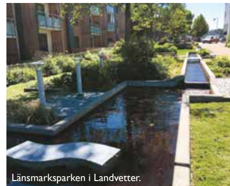
Länsmarksparken i Landvetter.