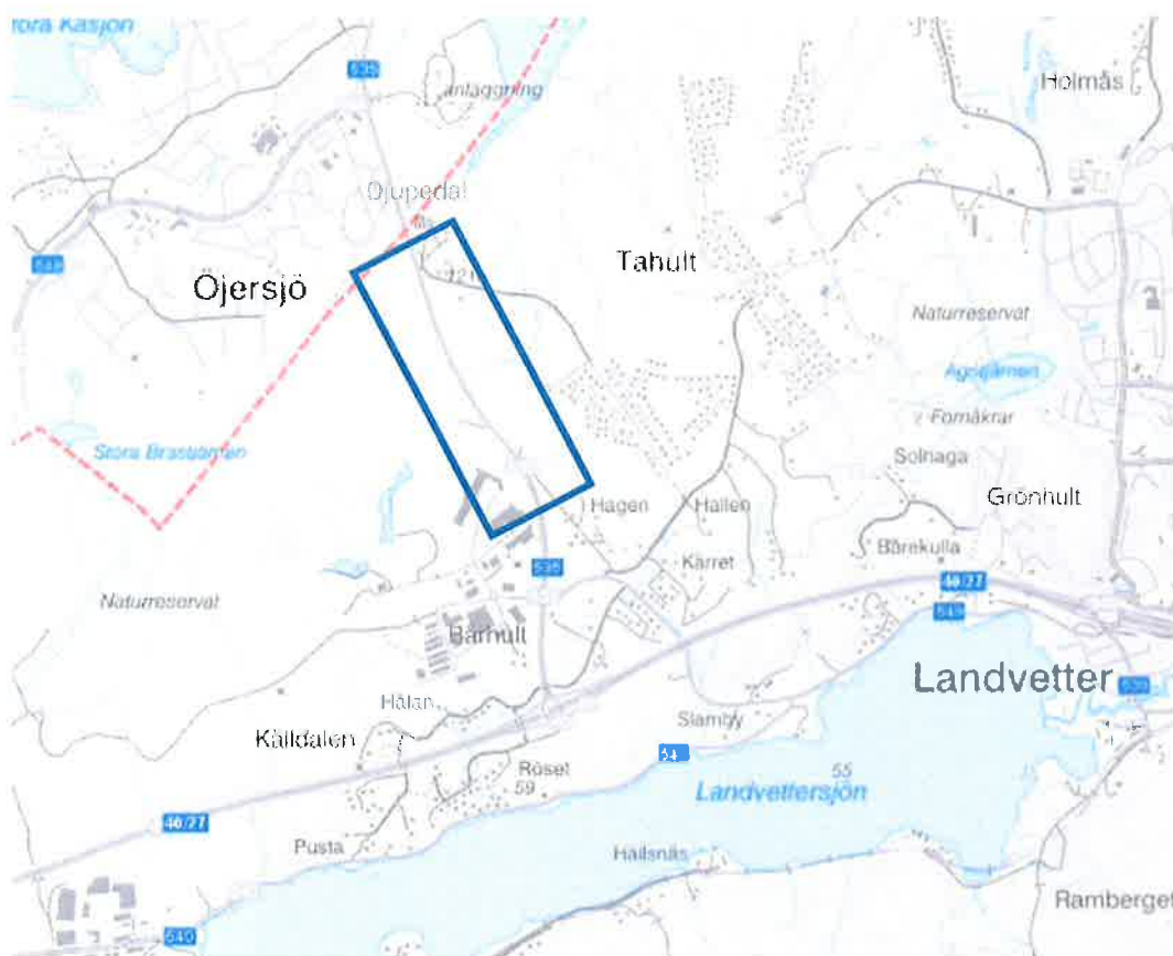
Figur 1 Översiktskarta över aktuell plats markerad med blå färg.