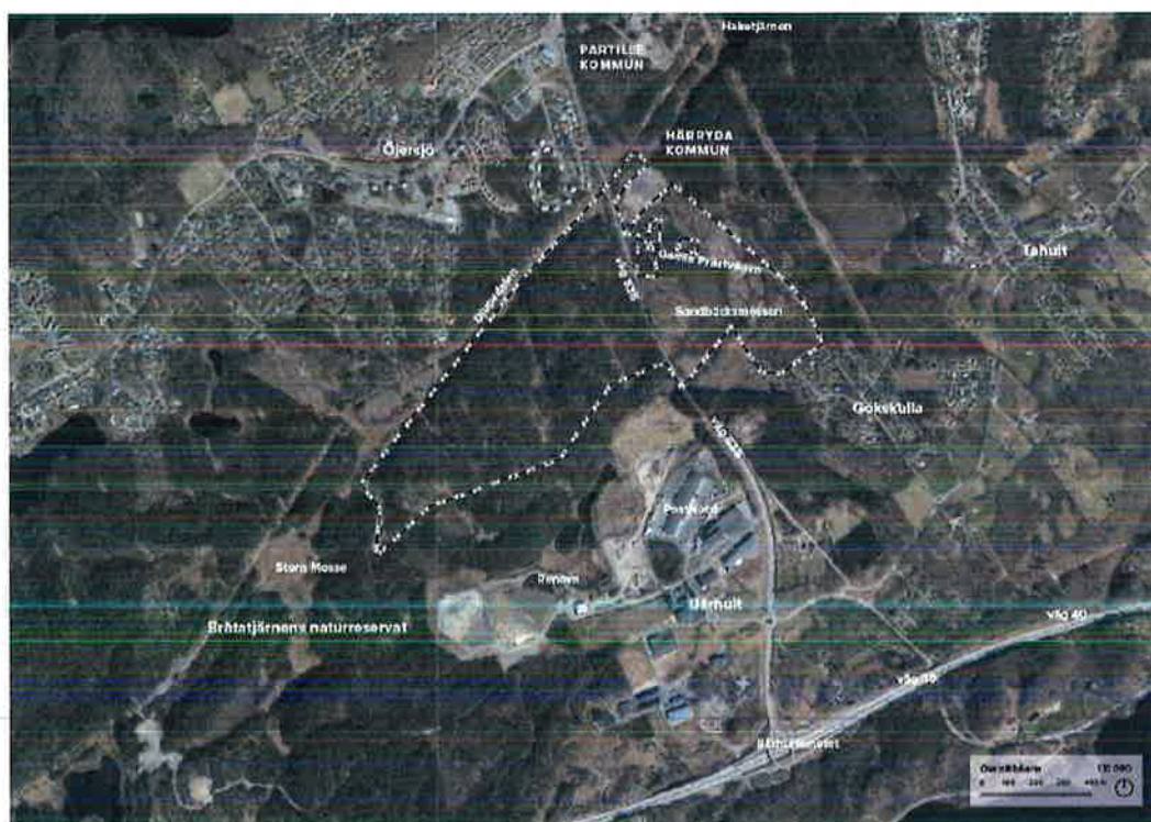
Figur 2 Planområde för Link 40

Åtgärden innebär framtagande av vägplan/planläggningsprocessen för den aktuella sträckan på väg 535, från punkten där befintlig gång- och cykelväg slutar i söder till kommungräns Partille i norr, som beskrivs i avtalet och vars finansiering regleras i avtalet. Sträckan är cirka 800- 1000 meter lång.