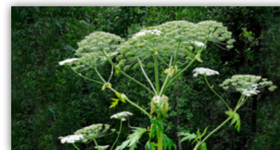
Björnloka, även kallad jätteloka, bredloka eller tromsöloka