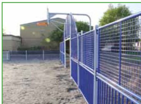
Näridrottsplats. En ny fin näridrottsplats på Rävlandaskolan är under uppbyggnad.

– Det här är jättebra träning och väldigt fint så här i skogen. Här kommer jag nog