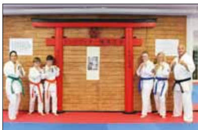
Grundaren. Elever och instruktörer poserar vid grundaren för karateinriktningen.