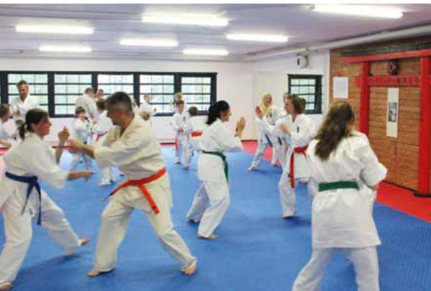
Nya lokaler. Landvetter karateklubb har hittat nya lokaler som har gjorts i ordning.