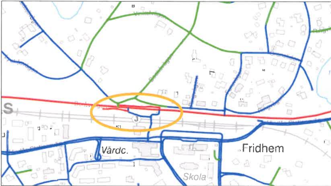
Figur 1 Gul markering visar aktuell plats för trafiksäkerhetshöjande åtgärder på statlig väg 554 och passagen över järnvägen som är aktuell för utredning.

platser, kvartersmark och vattenområden och gränserna för dessa. Detaljplanen reglerar rättigheter och skyldigheter, inte bara mellan markägarna och samhället utan också markägarna emellan. Planen är bindande vid prövning av lov.