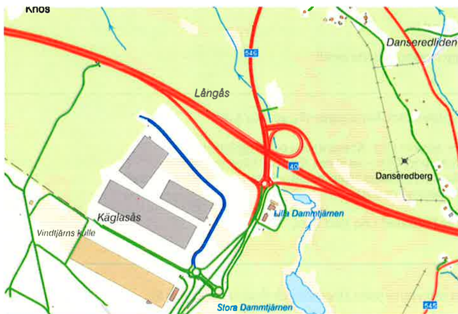
Figur 1. Översiktlig kartbild över Flygplatsmotet. Röda linjer visar de vägar där staten (Trafikverket) är väghållare, blå linjer visar vägar där Kommunen är väghållare och gröna linjer visar väg med enskild väghållning.

Utöver ovan nämnda åtgärder har det inkommit inspel från Kommunen angående önskemål om två stycken hållplatslägen längs väg 546 i anslutning till norra cirkulationsplatsen. I Avtalet hanteras planläggning, projektering och byggnation av dessa två hållplatslägen.