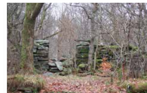
Ruinen på Labbera byggdes på 1800-talet.