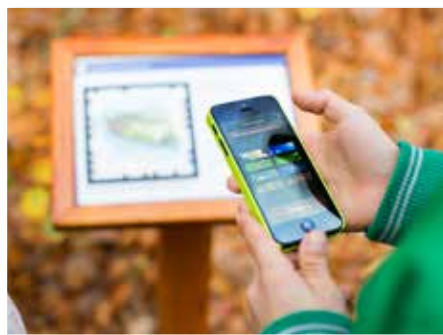
Naturfrågan består av sju skyltar med frågor om djur och natur.

Om du har en smartmobil blir promenaden på Naturstigen extra rolig. Här finns nämligen skyltar med frågor som du besvarar med hjälp av en app. Appen Naturfrågan Mölnlycke laddar du ner från AppStore eller PlayStore.