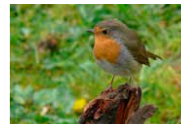
Rödhaken, bland många andra fåglar, trivs på Labbera.