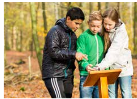
Gör Naturfrågan ensam eller ihop med någon – kanske kan ni tävla om vem som lyckas bäst!

Genom att svara på frågorna lär du dig en massa om naturen.