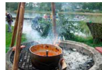
På Labbera finns mysiga ställen för en fikapaus. Grilla korv eller laga soppa kan du göra vid Hästviken.