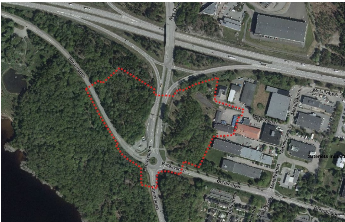
Ortofoto med markering av planområdet

Förslag till detaljplan för del av fastigheten Råda 1:1 m.fl., MÖLNLYCKEMOTET , i Mölnlycke, Härryda kommun