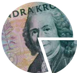
Kommunalskatt 20,62 kronor per hundralapp

Avgiften till Svenska kyrkan eller till andra trossamfund varierar. Du som tjänade mer än 401 100 kronor betalade 20 procent eller mer i statlig skatt.