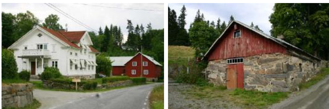
(Figur 2,3) Det vita huset är en välbevarad mangårdsbyggnad i byn Apelnäs, uppförd 1871. Bilden till höger föreställer smedjan på granngården Apelnäs 1:5, uppförd under 1800-talets senare hälft.

Apelnäs mest framträdande byggnad är mangårdsbyggnaden på den södra gården. En vit träbyggnad av salsbyggnadstyp ligger invid vägen, där den uppfördes 1871. Byggnaden är i mycket välbevarad, rikt smyckad med snickeridetaljer och spröjsade fönster. Granngårdens mangårdsbyggnad är uppförd 1908 med nationalromantiska stilideal. Den rödmålade fasaden är rikligt utsmyckad med snickerier, spröjsad veranda och med fasaden täckt av spånpanel. På gården finns också smedja och bagarstuga bevarade, uppförda någon gång under 1800-talets senare hälft. Apelnäs tre välbevarade gårdar ligger samlade på båda sidor om huvudvägen. Eftersom marken som byn är anlagd på är kuperad har de flesta byggnaderna försetts med kraftiga naturstensgrunder. I byn finns också stenmurar och anlagda stenterrasser som ramar in trädgårdar och beteshagar.