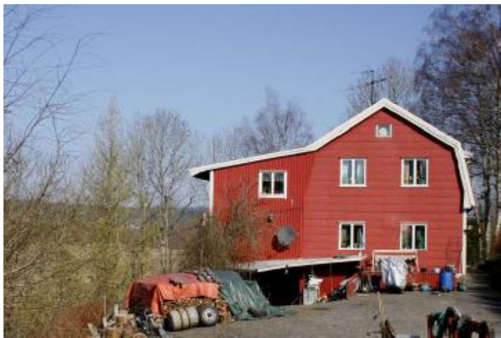
(Figur 15) Snickeribygnaden står fortfarande kvar på sin strategiska plats mellan landsvägen och Storån som var snickeriets kraftkälla. En turbin drev maskinerna med hjälp av remdrift.