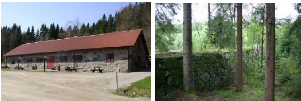
(Figur 4,5) Bilden till vänster föreställer stallbyggnaden på gården Smedstorp. Byggnaden är helt uppförd i natursten. Till höger skymtar den kraftiga muren som dämt vatten till Smedstorps kvarn.