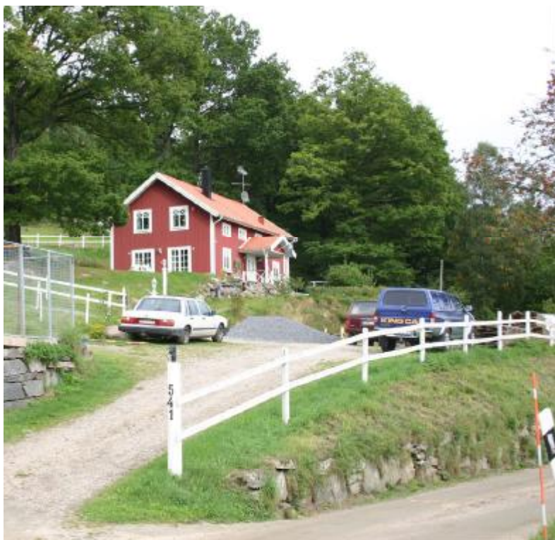
(Figur 18) Nytt bostadsbus vid Dalagården där befintliga topografiska förhållanden har tillvaratagits.