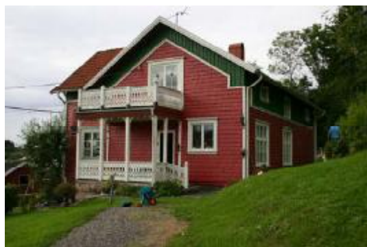
(Figur 10, 11) Två av dalgångens byggnader som är inspirerade av sekelskiftets nationalromantiska villaideal, Värredal och Apelnäs 1:5.