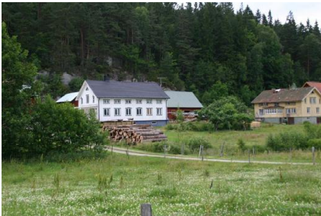
(Figur 7) Bilden föreställer två av byn Funubergs gårdar, två välbevarade mangårdar av salsbyggnadstyp. De båda gårdarna utgör idag samma bruksenhet.