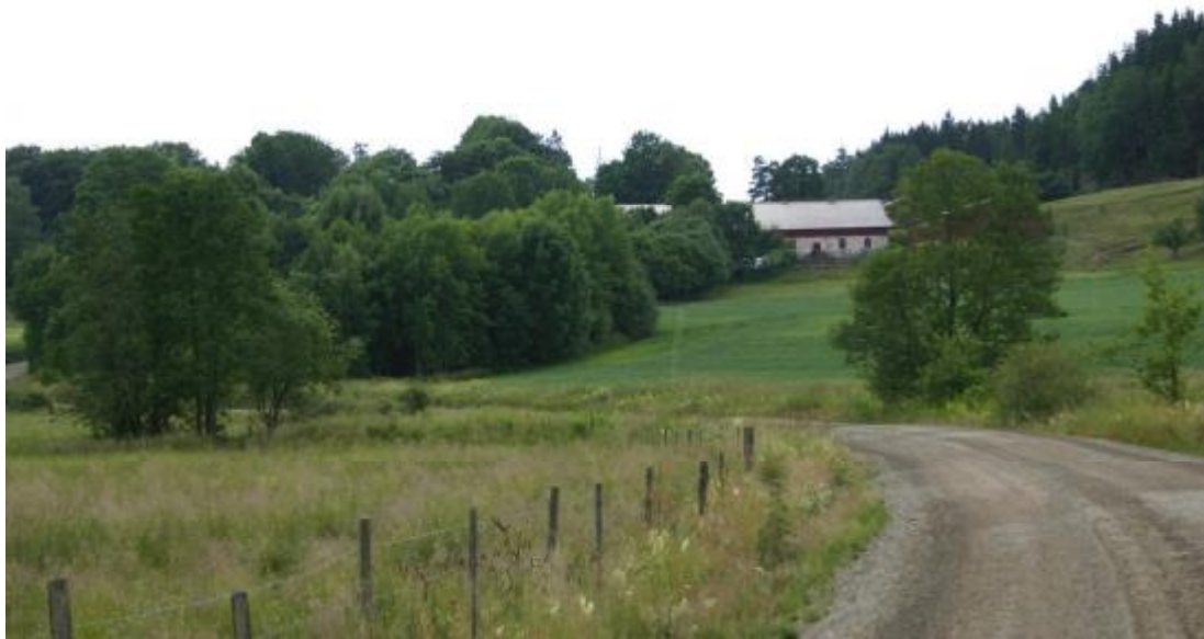
(Figur 12,13) Bilden förställer grusvägen i dalgångens västra del. Här leder den från Rävlanda vidare upp mot gården Smedstorp.

Vägarna i Storåns dalgång är upptagna i Vägverkets vägminnesvårdsprogram. Länsvägen 528 är huvudled i dalgångens östra sida. Huvudvägen i dalgångens västra sida är en grusväg som på liknande sätt binder samman byarna och de utspridda gårdarna.