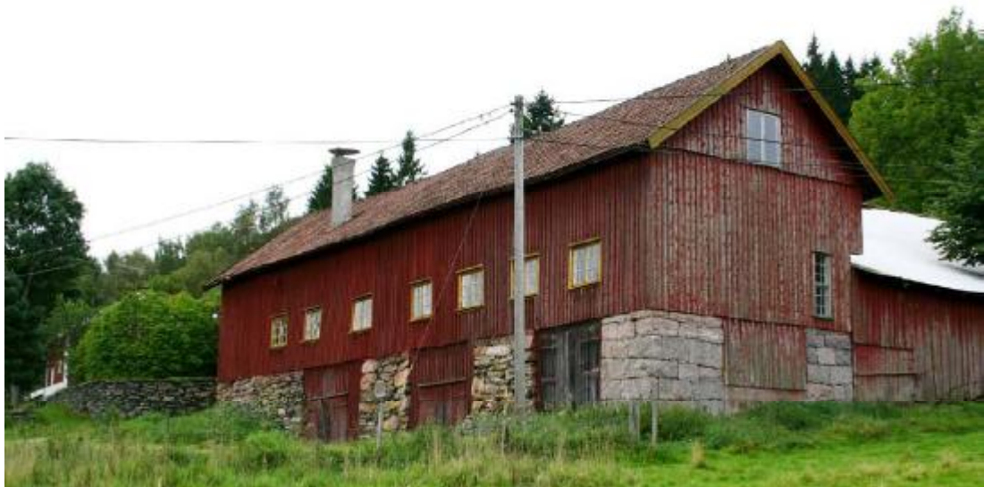
(Figur 16) Gedigna naturstensgrunder är vanliga i hela dalgången. Karaktäristiskt för området är de omfattande terrasseringar kring trädgårdarna, syns vänster i bild.

I dagsläget brukas dalgångens jordbruksmark av ett fåtal aktörer som arrenderar stora arealer. Fortfarande finns dock markerade fastighetsgränser bevarade i landskapet. Stengärdesgårdar och staket markerar åkrar och gårdsenheter vilket bidrar till förståelsen för det småskaliga jordbruk som varit så vanligt. Mindre vägar och gamla fägator bildar också ett viktigt inslag i det system som tydliggör brukandet av det traditionella odlingslandskapet.