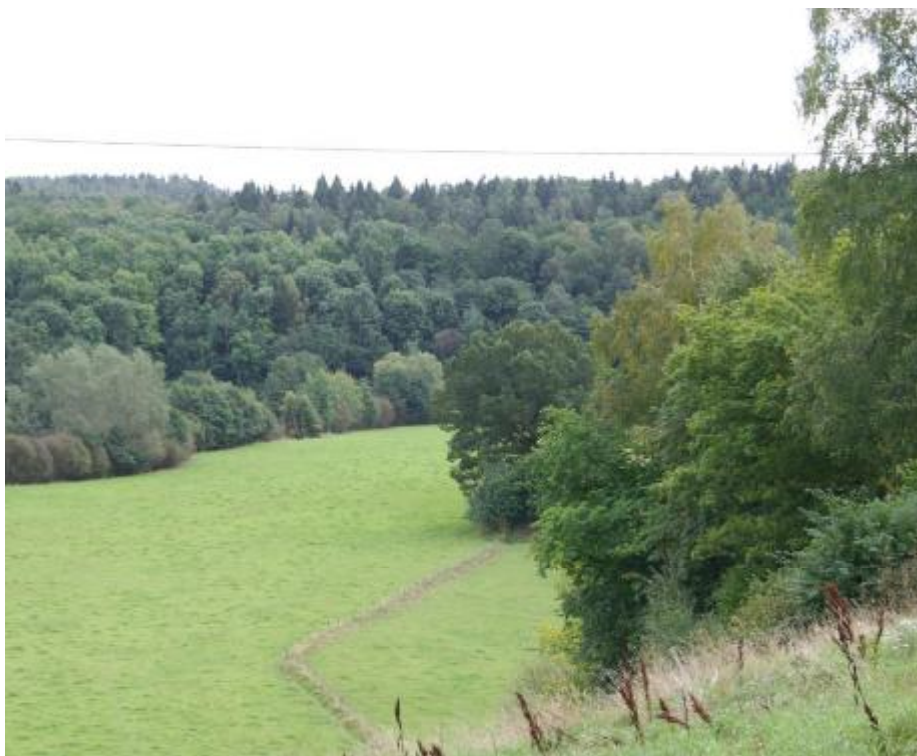
(Figur 17) Äldre ägo- och brukargränser finns kvar i landskapet även om odlingsmarken i dag brukas av ett fåtal aktörer.

Dalgångens alla mindre broförbindelser som nästan kan betecknas som genvägar är viktiga för möjligheten att avläsa dalgångens äldre levnadsmönster. När dalgången förr var relativt tätbefolkad var troligen trafiken inom dalgången betydligt mer frekvent. De lokala vägarna och broarna utgör därför en viktig del i områdets kulturhistoriska struktur.