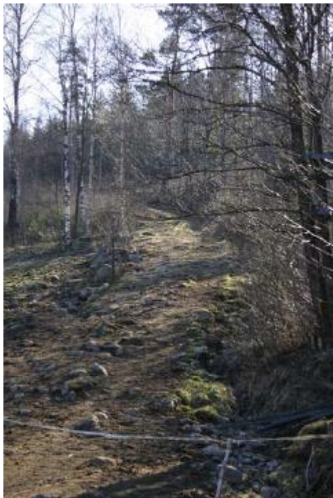
(Figur 14) Resterna av en fägata öster om Nedregården i Värred.

Landsvägar, fägator och broar bildar ett system som är en viktig del i kulturlandskapet. Äldre vägar och nya utgör ett tydligt mönster om hur de boende har nyttjat och brukat området. Storåns dalgång har minst fyra kända broförbindelser. Förutom bilbron söder om Rävlanda finns fortfarande en farbar bro vid Apelnäs. Det finns en passage i höjd med Villingsgårde och Bosgårdens kraftstation (Marks kommun). Även vid Värred finns en genväg, över bron ”Stocken”.