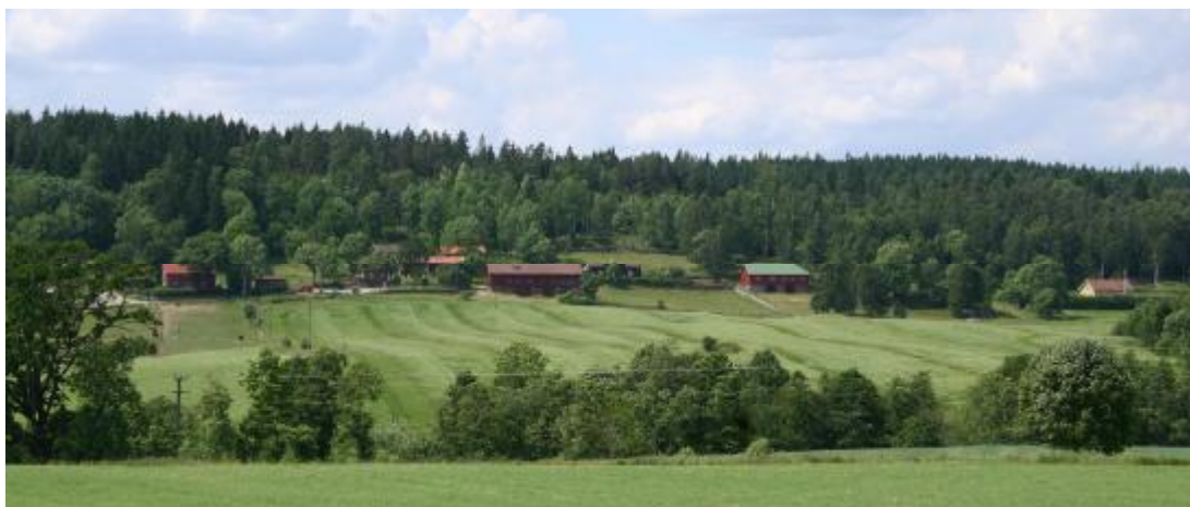
(Figur 6) Gårdarna i byn Backa ligger som de flesta byarna i dalgången sedan laga skifte i rad på sluttningen längs vägen.

Vid tiden för laga skifte, var byn Backa uppdelad i fyra gårdar, som låg placerade i klunga på sluttningen. Vid skiftet flyttades två av gårdarna ut så att bebyggelsen kom att ligga mer sida vid sida. Flera byggnader i Backa är bland de äldre i hela dalgången. Mangårdsbyggnaden på Backa 1:4 är en välbevarad långloftsstuga från 1760-talet. På Backa 1:5 finns en tvåvånings parstuga uppförd 1858. I anslutning till gårdarna finns en inhägnad fägata bevarad. Sedan en tid driver Franciskanerorden verksamhet på gården Backa 1:4. Till byn hör två välhävda torpmiljöer som ligger väster om gårdarna. En brant väg leder upp över skogen och vidare till torpen.