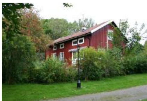
(Figur 8,9) Bilderna föreställer de båda f.d skolbyggnaderna i Stockabäck. I byggnaden till vänster drivs idag ett café en rörelse som nu utökats till rumsuthyrningsverksamhet i byggnaden på bilden till höger.