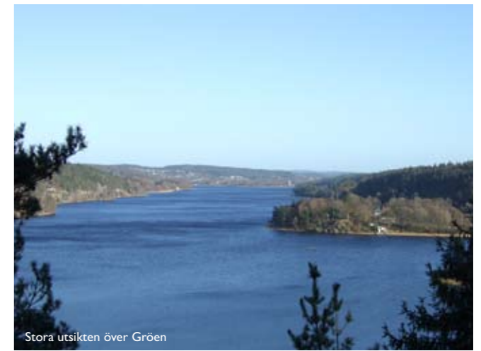
Stora utsikten över Gröen