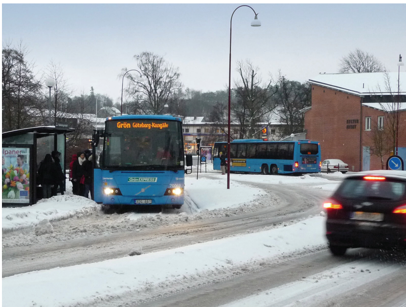
Grön express plockar upp frusna gymnasieelever utanför Hulebäcksgymnasiet.

En tät struktur har även fördelar ur transportsynpunkt. Utöver att de privata resorna med bil kan minska kan även industriella transporter minska. Med en tätare struktur kan även infrastruktur samordnas och utnyttjas effektivare. Täthet kan även ha samhällsekonomiska effekter såväl som estetiska och upplevelsemässiga effekter.