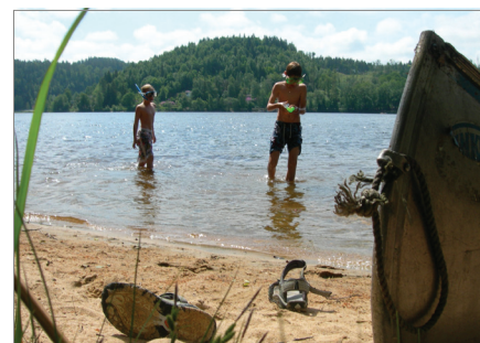
En sommardag vid(i) Västra Ingsjön.

Att skapa en trygg miljö kan handla om allt från att skapa säkra trafikmiljöer till att skapa ett levande samhälle där människor vill uppehålla sig och inte är rädda för att vistas under någon tid på dygnet. Den upplevda tryggheten är ofta minst lika viktig som den faktiska. För att människor ska känna sig trygga även under dygnets mörka timmar är det viktigt att offentliga platser samt huvudstråken för gång och cykel är integrerade i bebyggelsen, har god belysning samt att det finns god överblickbarhet. Känslan av trygghet är en av de grundläggande förutsättningarna för om människor trivs på en plats eller inte.