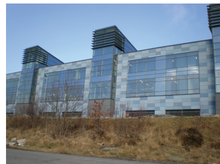
Elanders tryckeri. Ett av flera företag som det senaste deceniet valt att etablera sig i Härryda kommun.