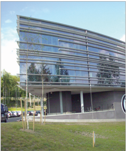
Kontorsbyggnad i Mölnlycke Företagspark från 2000-talet. Bra exempel på modern arkitektur.