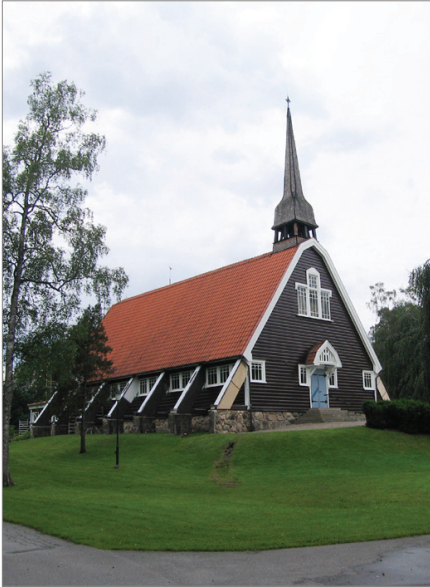
Hindås kyrka är byggd i en nationalromantisk stil, tidstypiskt för 1910-talet.