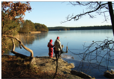
Isen har lagt sig på Finnsjön vintern 2009.