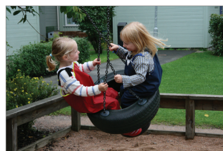
Närhet till en lekplats kan betyda trygghet för en förälder.