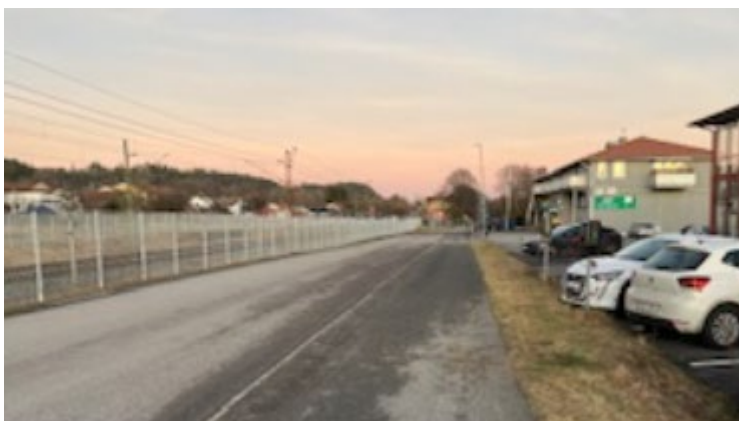
Bilden ovan visar den centrala Stationsvägen, som idag omges av järnvägsstaket och obrukad gräsyta med potential att bilda välkomnande rumsbildande miljö med trivselskapande rabatt. I fonden Rävlandas mataffär Tempo och järnvägsstationen med återvinningsstationen i förgrunden.