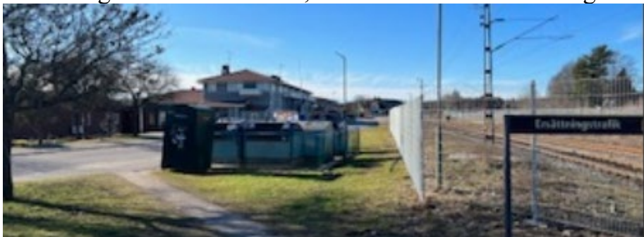
Bilden ovan visar återvinningsstationen som möter besökare som angör orten med tåg.