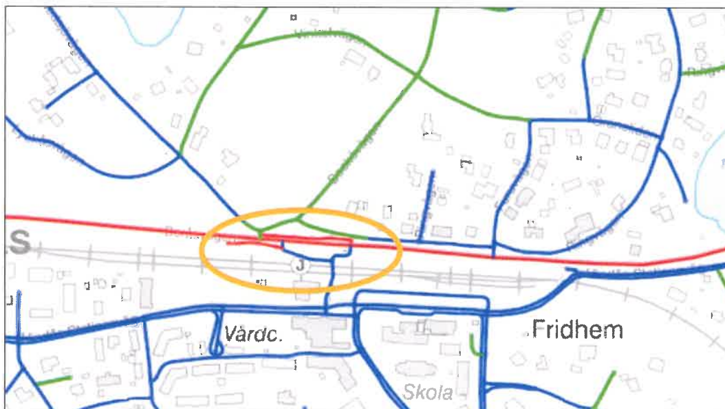
Figur 1 Gul markering visar aktuell plats för trafiksäkerhetshöjande åtgärder på statlig väg 554 och passagen över järnvägen som är aktuell för utredning.

platser, kvartersmark och vattenområden och gränserna för dessa. Detaljplanen reglerar rättigheter och skyldigheter, inte bara mellan markägarna och samhället utan också markägarna emellan. Planen är bindande vid prövning av lov.