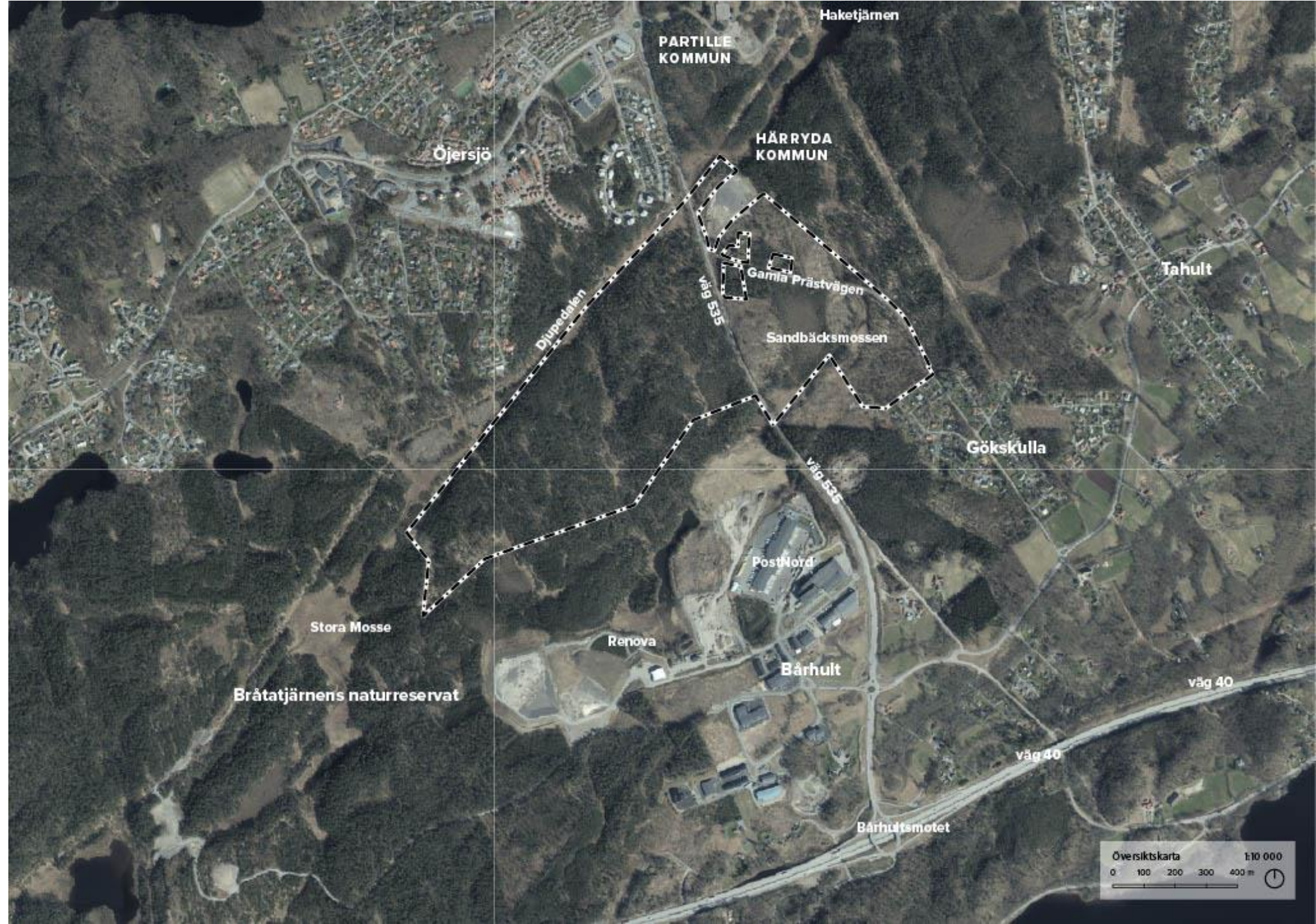
Figur 1. Planområde för Link40